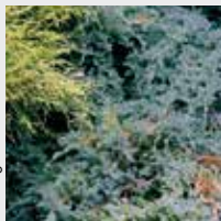
InterCityHotel Hamburg Dammtor-Messe