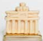
InterCityHotel Berlin Hauptbahnhof