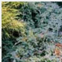
InterCityHotel Hamburg Dammtor-Messe